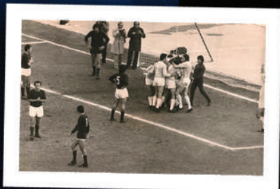
09.12.1973 - Lazio-Roma 2-1, la sorpresa Franzoni e il solito Chinaglia per il primo Scudetto