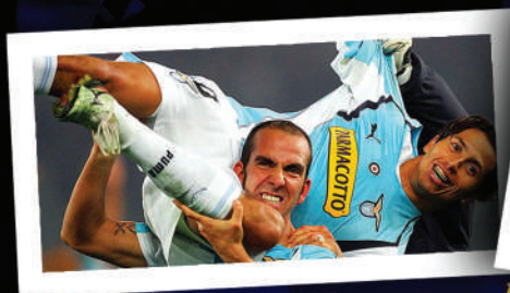
06.01.2005 - Lazio-Roma 3-1, Di Canio 16 anni dopo