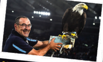
26.09.2021 - Lazio-Roma 3-2, buona la prima di Sarri