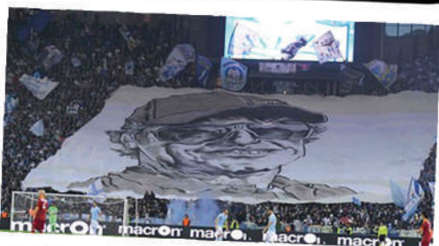
11.11.2012 - Lazio-Roma 3-2, vittoria nel segno di Gabriele Sandri