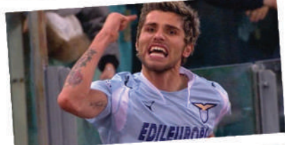
19.03.2008 - Lazio-Roma 3-2, Behrami all'ultimo respiro con "Testa e cuore"