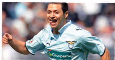
11.04.2009 - Lazio-Roma 4-2, l'uno-due biancoceleste dopo 4'