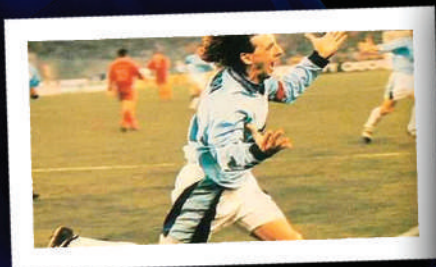
18.02.1996 - Lazio-Roma 1-0, Signori su rigore nel finale