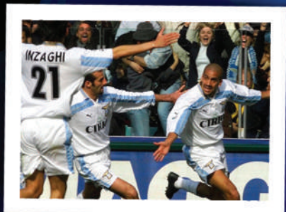
25.03.2000 - Lazio-Roma 2-1, la magia di Veron per lo Scudetto