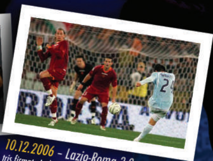
10.12.2006 - Lazio-Roma 3-0, Iris firmato Ledesma, Oddo e Mutarelli