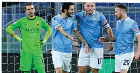
15.01.2021 - Lazio-Roma 3-0, trionfo nel primo derby a porte chiuse causa Covid