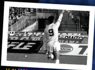
15.01.1989 - Lazio-Roma 1-0, Di Canio regala il successo dopo 10 anni